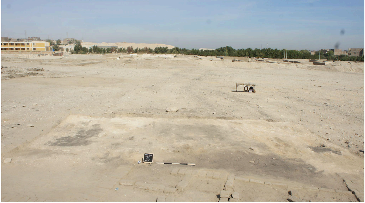
الشكل ٢. العمل في المنازل الواقعة شمال "القصر الشمالي"