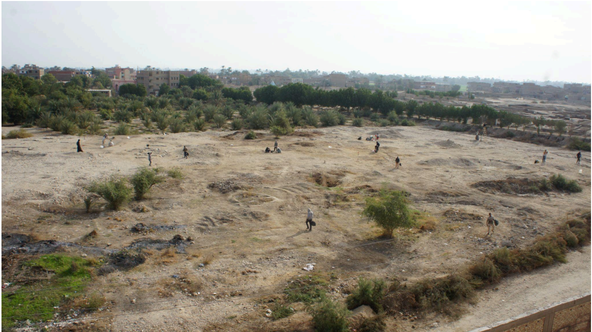
الشكل ٣. العمل في منطقة الاستيطان ب "الوادي الشمالي"