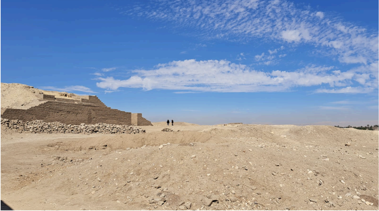
الشكل ٤. "القصر الجنوبي" المُرَّم