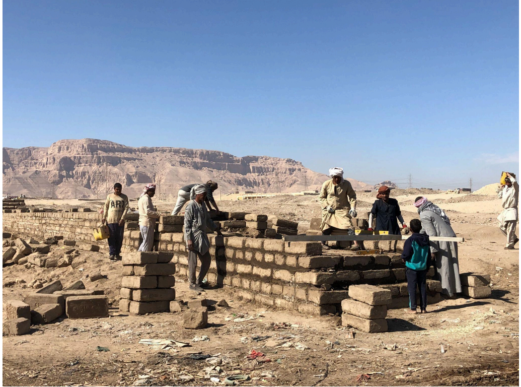
الشكل ١. أعمال الترميم في "القصر الشمالي" والسور المحيط به، للحفاظ على البقايا الأثرية والعمل كحاجز للموقع