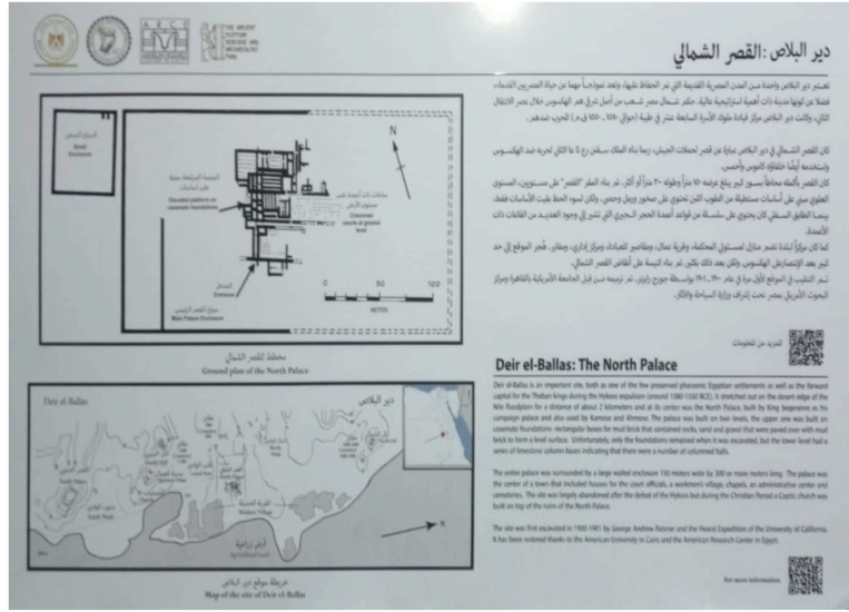
الشكل ٧. لافتة البعثة للقصر الشمالي التي تم طباعتها وتخزينها في القاهرة حتى تتمكن من تثبيتها بالموقع في موسمنا القادم في دير البلاص.